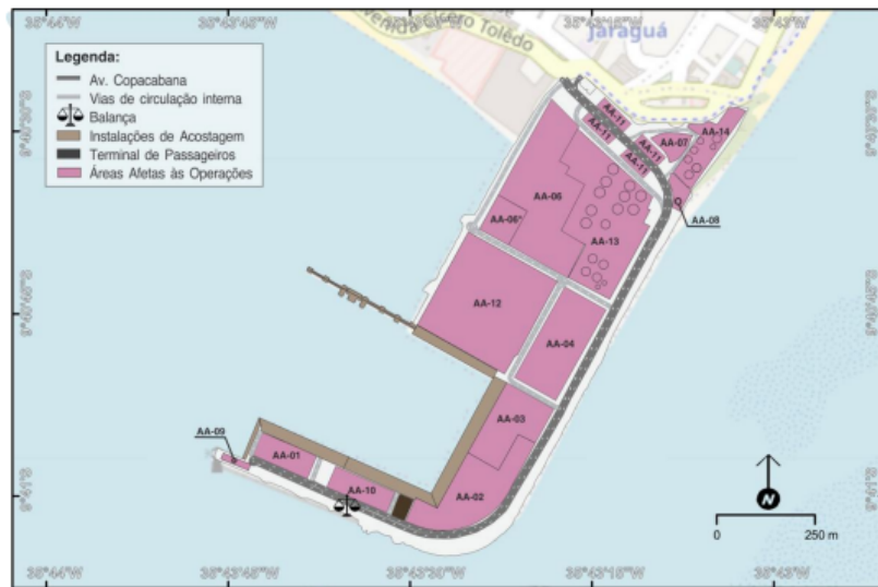
Figura 02: Área de arrendamento MAC14/AA-02 – Porto de Maceió.